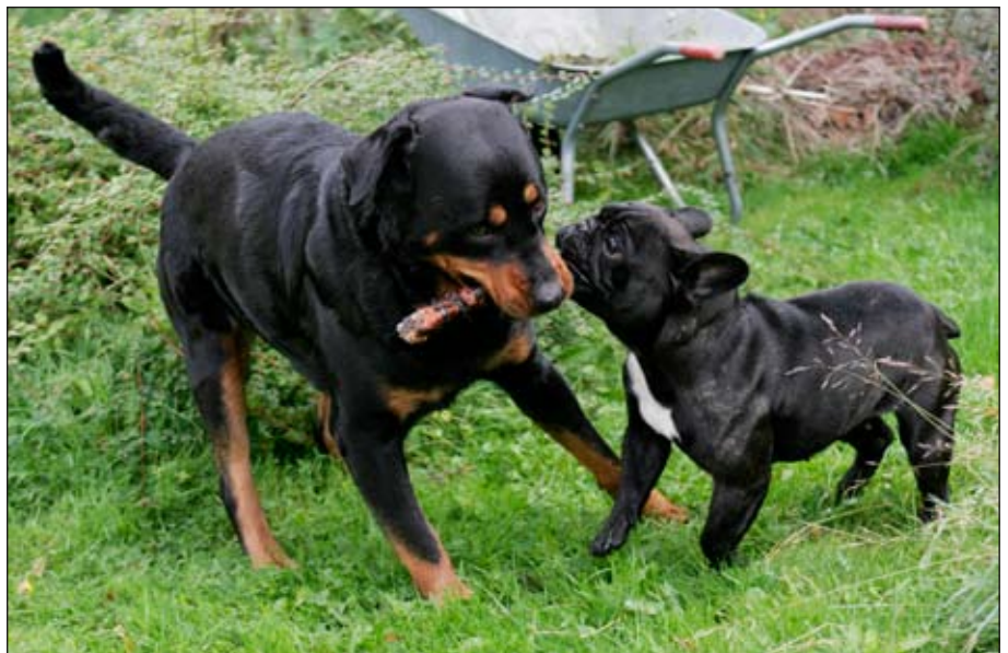
Rottweilern elsker typisk små dyr af enhver slags og passer godt på dem. Hvis der opstår problemer, vil det nærmere være med artsfæller på grund af den dominans, der – især hos hannerne – ligger til racen. De slås ikke ofte, men når det sker, kan det godt gå hårdt for sig.

- Især hannerne vil gerne prøve kræfter og ind imellem protestere imod tingene livet igennem, så du skal sørge for at være kontant i dine udmeldinger. Det er en hund med modstand; den har en vis portion stædighed og viljestyrke, men det er jo netop derfor, det er så sjovt og spændende at have den. Jeg vil ikke anbefale første-gangshundeejere at købe en ☹