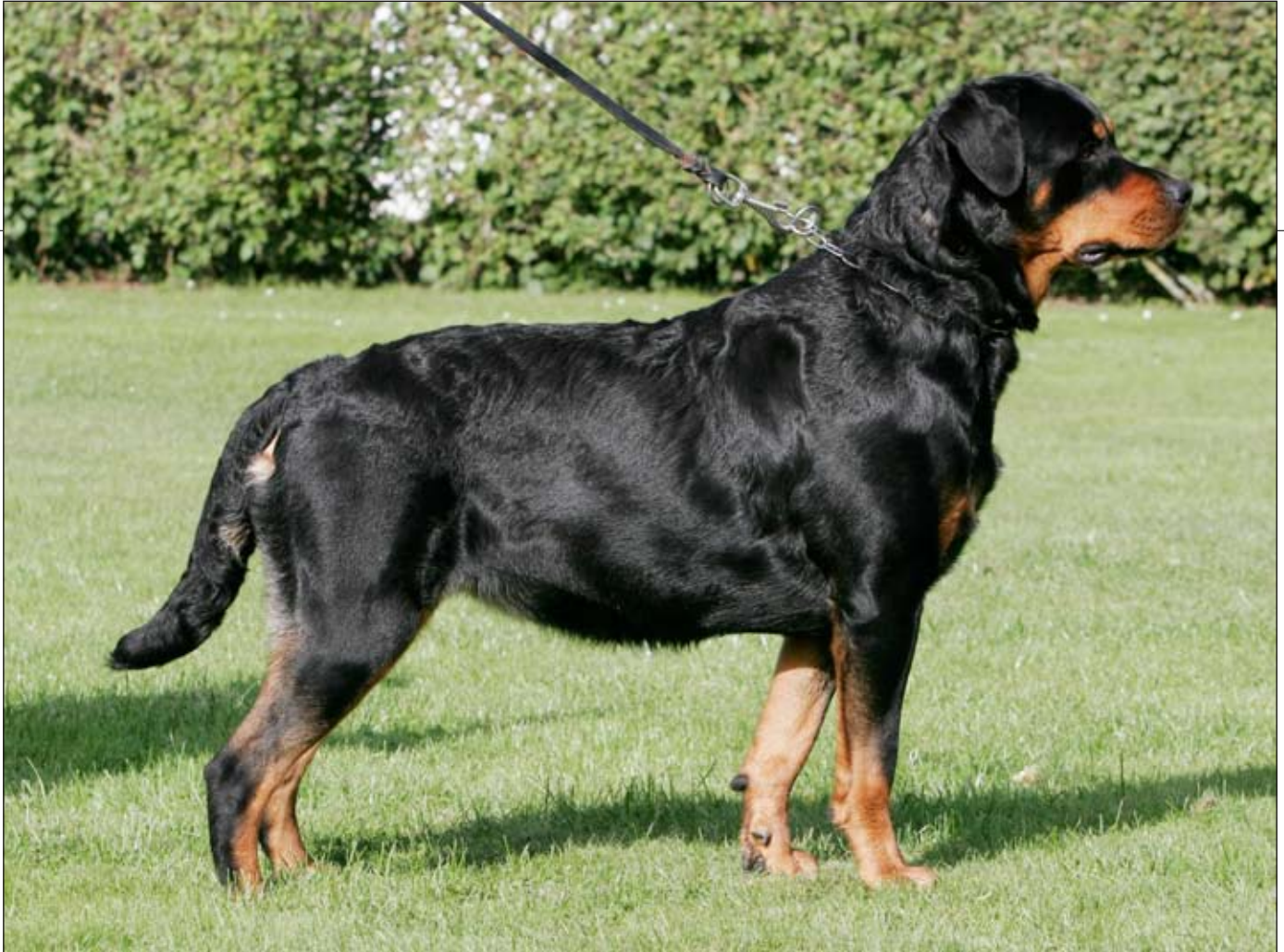
Rottweilern er en robust og stærk hund.

en dårlig dag, udfører den ikke øvelserne optimalt.